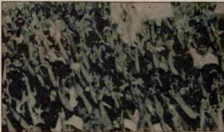
Marcos'u devirmenin sevinci uzun sürmeyecek

Duvalier'nin Haiti'den kovulmasından sonra Duvalier'nin adamları yeni kurulan hükümet içinde de varlıklarını sürdürüyorlardı. Halk sürekli sokak gösterileriyle hükümeti zorladı ve hükümet Duvalier'nin üç adamını çıkarmak zorunda kaldı.