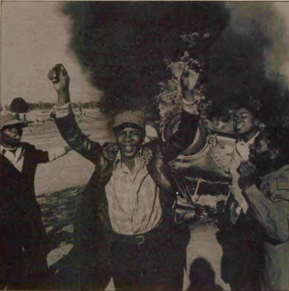
Güney Afrika'da devrim çocukların bile kalbinde

Cape Town'da Port Elizabeth'e yakın Kwazakele kasabasında gösteri yapan gençlere polis ateş açtı. 10 kişiyi öldürdü. Cape Town'daki bu son katliamla, bir hafta içinde öldürülenlerin sayısı 40'ın üzerine çıktı. Botha hükümeti Cape Town'ı kontrol edebilmek için seçme paraşüt birliklerini bölgeye göndermek zorunda kaldı. Ama bu baskılar, katliamlar sadece yığınların kararlılığını artırıyor, mücade- nin boyutlarını yükseltiyor ve halk iktidarının nüvelerini oluşturma çalışmalarının güç kazanmasına yol açıyor.